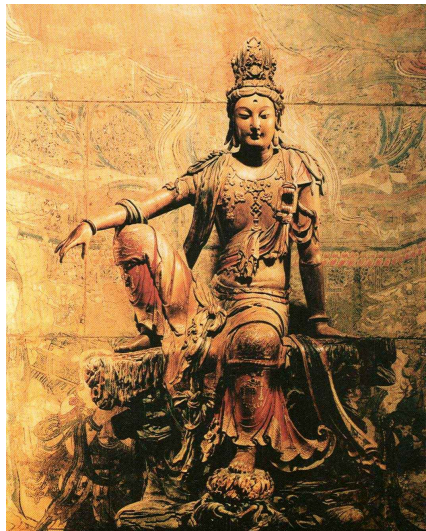
Kuan Yin o GuanYin, la diosa bodhisattva de la compasión

Salir al mundo desde estos registros tiene un significado nuevo que retroalimenta y consolida lo experimentado.